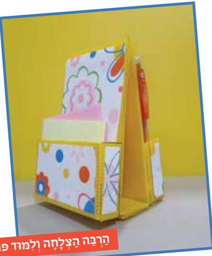
הרבה הצלחה ולמוד פורה!

15. נקח דף או טפט צבעוני, ונגזר מלבנים שפמעט מכסים כל חלק מהמעמד. גדלי המלבנים: שני מלבנים של 9.5x9.5, שני מלבנים של 9.5x5.5, ארבעה מלבנים של 5.5x1.5. נצמיד למעמד בדיוקנות. היפי הוא השוליים הקטנים והאחידים שנושארים מסביב.