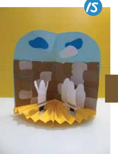
15. הוֹפֵפ - רַק פְּתַחְנוּ וְכִבֵּר הַתִּנְצָב הַצְּבוּר לְתַפְּלָה חֲמָה: 'וְלִירוּשָׁלַיִם עִירָה בְּרַחֲמִים תִּשׁוּב...' קְלָנוּ מְצֻטְרָפִים!