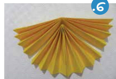
6. אִם תִּרְצוּ אֶת רַחֲבַת הַכֶּתֶל גְּדוּלָה וְנִרְחֶבֶת יוֹתֵר - קַפְלוּ אִקוּרְדִּיוֹן נֶיֶר זֶהָ נוֹסֶף, וְהִצְמִידוּ כְּמִסְגֵּרֶת מִחוּץ לְאִקוּרְדִּיוֹן הָרֵאשׁוֹן.