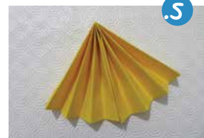
5. נְקַפֵּל אֶת הָאִקוּרְדִּיוֹן בְּאִמְצַע לְחֻצֵי כְּמוֹ מְנִיפָה, וְנִצְמִיד אֶת הַקְּצוֹת זֶה לְזֶה בְּדָבָק.