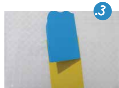
3. נִקַּח בְּרִיסְטוֹל נוֹסֶף שֶׁיִשְׁמַשׁ כְּכִסִּים, הַרְצָפָה שֶׁל רַחֲבַת הַכֶּתֶל. נְקַפֵּל גַּם אוֹתוֹ לְשָׁנִים, וְנְצַר גַּם אוֹתוֹ - אִם מְעֻט פְּחוֹת מִהַדָּף הַתָּכֵל (כְּדִי שִׁישְׂאָרוֹ שׁוֹלֵים לְהַדְבִּיקָה).