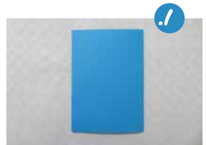
1. נְקַפֵּל דֶף בְּרִיסְטוֹל תָּכֵל לְשָׁנִים

דְּפִי בְּרִיסְטוֹל צְבֵעוֹנִי מִסְפָּרִים וְדָבָק