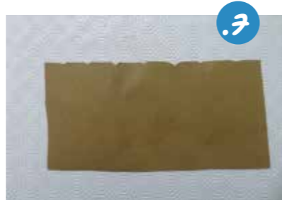
7. קַעֲת נִגְשׁ לִיצִירַת הַכֶּתֶל הַמַּעֲרָבִי. מְבַרִיסְטוֹל חוּם נְגֹזֵר מִלְבָּן בְּגִבָּה הַרְצוּי וּבְרֹחֵב הַמְּכֻסָּה בְּדִיוֹק אֶת רֹחֵב הַרְקַע הַתָּכֵל. מִהַקְצֵה הָעֶלְיוֹן נְסִיר מְשֻׁלְשִׁים קְטַנְטָנִים כִּי שִׁינְצֵר מִרְאֵה שֶׁל אֲבָנִים.