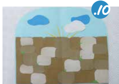
10. נִצְמִיד אֶת הַכֶּתֶל לְרַקַּע הַתָּכֵל. נוֹסֶף בְּשָׂמִים עֲנָנִים, אֲנִי הוֹסֵפְתִי מֵאֲחוּרֵי הַכֶּתֶל גַּם קֶרְנִים דְּקִיקוֹת שֶׁל אוֹר צָהָב, הַמְבִשְׂרוֹת אֶת הַגְּאֻלָּה שֶׁמִּמֶּשׁ עוֹמְדָת לְזֶרֶחַ...