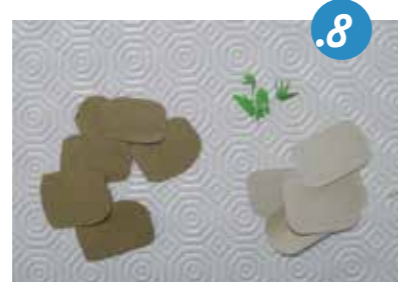
8. מְבַרִיסְטוֹלִים בְּגוֹנִים מִתְאִימִים נְחַתּוּ אֲבָנֵי כֶּתֶל - מִלְבָּנִים שֶׁקְצוּתֵיהֶם עֲגֻלִים, בְּגִדְלִים שׁוֹנִים, וְכוּ מְעֻט יָרֵק.