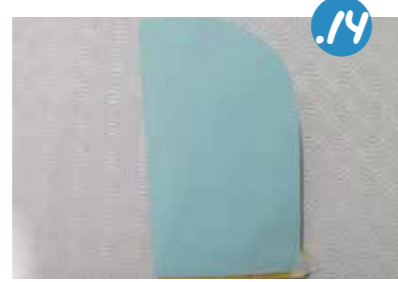
14. הִנֵּה כֶּכָּה זֶה נִרְאֶה סָגוּר. אִי אֶפְשֵׁר לְנַחֵשׁ מַה מִתְחַבֵּא בְּפָנִים...