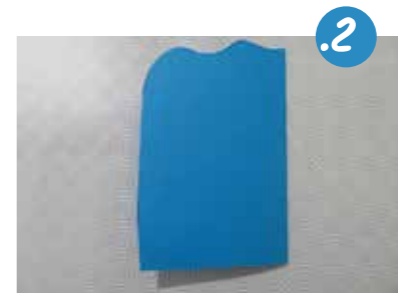
2. נְגֹזֵר אֶת צֵדוֹ הָעֶלְיוֹן בְּצוּרָה מְעֻגְלָת אוֹ גְּלִית, לְעֲצוּב נֶאֱדָה שֶׁל קֶצֶה הַשָּׂמִים. נְצַר מְעֻט אֶת הַמִּלְבָּן, כִּי שִׁיתְקַבֵּל מִרְאֵה צֶר וְגִבּוֹה.