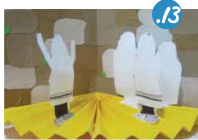
13. נִמְקַם אֶת הַמְתַפְּלָלִים עַל גְּבֵי הַרְצָפָה, בִּיּוֹ קַפְלֵי הָאִקוּרְדִּיוֹן - חִלְקִים קְרוּבִים יוֹתֵר לְכֶתֶל, וְאֲחֵרִים בְּמִרְחָק מְעֻט.