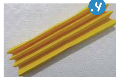
4. נְקַפֵּל אֶת בְּרִיסְטוֹל הַכִּסִּים לְאִקוּרְדִּיוֹן צִפּוּף.