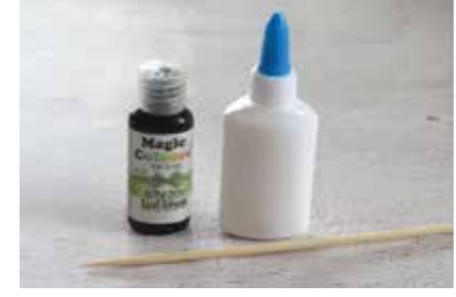
הצבעים עשויים מדבק פלסטי וצבעי מאכל. נכין בכל בקבוקון צבע שונה.