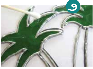
9. בעזרת מקל אֶזְנִים - מורחים כל צבע עד לטוליה בדייק.