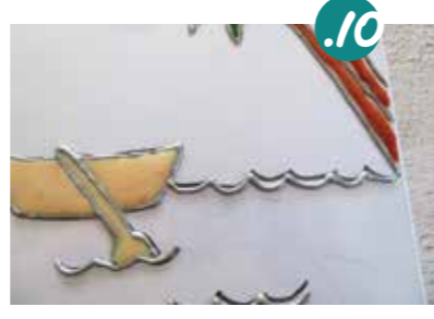
10. אפשר ליצור צבעים שונים על ידי טפטוף כמות שונה של צבע מאכל לתוך בקבוקון הדבק: למשל, כאן בתמונה גוני הסירה והעץ מוצרים מאותו צבע מאכל, פאשר לצבע הסירה טפטפתי כמות זעירה של צבע, ולצביעת העץ - הוספתי עוד מאותו צבע מאכל.