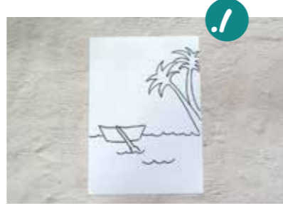
1. גזרים דף לגדל השקף, ומאירים עליו איור פשוט וקל שמתאים לצביעה. מניחים עליו את השקף.