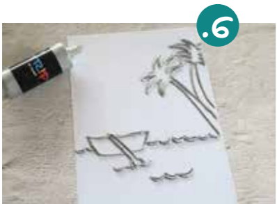
6. הנה התמונה שלמה. אם רוצים - אפשר להוסיף מסגרת טוליה סביב, כדי שצבע הרקע לא יזלג מחוץ לציור. עתה ממתנינים ליבוש מלא של הטוליה.