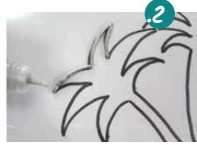
2. עוזרים בטוליה על קני המתאר של הציור. הטוליה אמור להיות הגבול בין הצבעים השונים שצבוע בהמשך. לכן שימו לב שהקו שלו יהיה עבה, ושיגע היטב בשקף (לפעמים הוא נשאר קצת באויר וזה לא טוב). כמו כן, ודאו שכל הקווים סגורים היטב ולא נשארת זווית קטנה פתוחה בלי טוליה, כי משם יוכלו הצבעים לזלג החוצה.