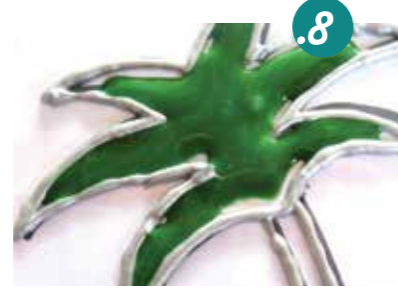
8. ממלאים את החלק פלו בצבע. אתם שמים לב שהצבע לא מגיע ממשי עד לטוליה?