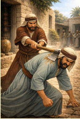
לְרִכְבָּה שְׁלֹשׁ (בְּעֵיטָה עִם הַכֶּרֶד)