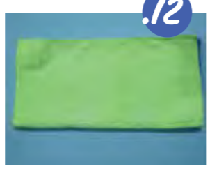
12. מניחים את הסמרטוטים זה על זה.