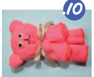
10. הדבי מוכן! תוכלו לעטר בסרט ובעינים זזות, ולציר בלורד פה מחיף.