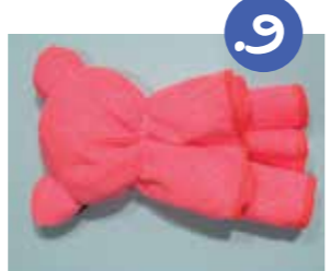
9. חוזרים על הפעולה גם באגון השנייה.