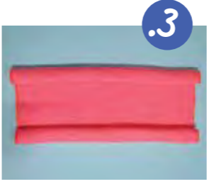
3. מגלגלים גם את הצד השני.