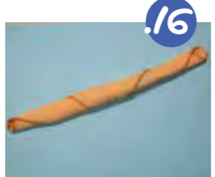
16. ממשיכים לגלגל עד לקבלת נחש ארוך.