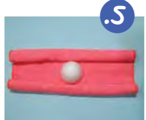
5. מניחים את חצי הפדור במרכז, קשהחלק הקמור-הבולט כלפי מעלה. (אם אין לכם פדור קלקר, תוכלו להחליפו במספר ממחטות או עתונים מקוצים).