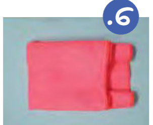
6. מקפלים צד אחד של הסמרטוט מעל הפדור. מתקבלת שכבה עליונה קצרה יותר מהשכבה התחתונה.