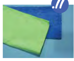
11. מקפלים שני סמרטוטים בצבעים שונים לחצי (שימו לב שפתק התוית של הסמרטוט מסתיר בתוך הקפול ואינו מציץ החוצה).