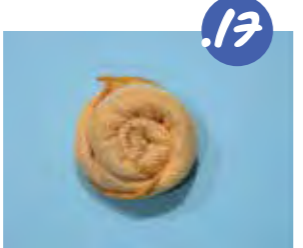
17. מסובכים את הנחש לצורת שבלול.