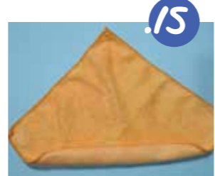
15. פורשים את הסמרטוט ומגלגלים אותו מכוון אחת הפנות.