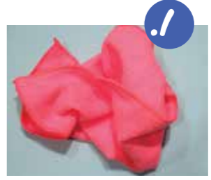
1. פורשים את הסמרטוט.