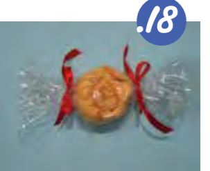
18. מכניסים לצלופון וקושרים בסרטים. מתוק ולא לאכילה!