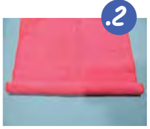
2. מתחילים לגלגל צד אחד עד למרחק של כשני ס"מ מהמרכז.