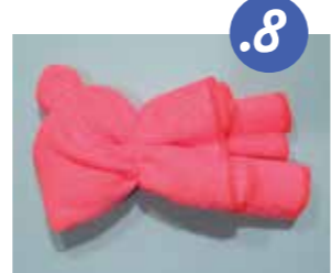
8. תופסים אגון אחת בגומיה.