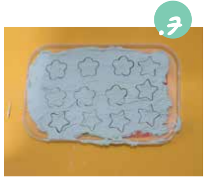
5. אפשר גם לקרץ 'עוגיות' בצורות לפני התבשות מלאה.