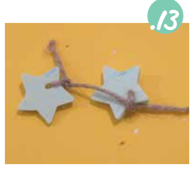
11. הוציאו בעדינות את הסבונים מהתבניות, והסירו את השאריות.