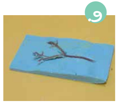
9. תוכלו להניח עלים או פרחים על המכסה או בתבנית לפני שתמלאו בסבון, כך העלה יטמע בתוך הסבון.