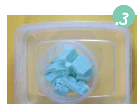
3. את הקפסה הכניסו לקפסה נוספת או הניחו על צלחת חד פעמית - הסבון גולש ונחבל שיוצר לכלוך.