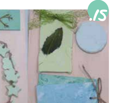
15. תלו או הניחו בצאונות, בחדרים - וכמובן, דאגו גם אתם להיות מפיצי אוויר טובה!