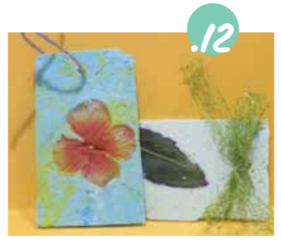
12. הוציאו בעדינות חוטים לקשוט ולתלה.