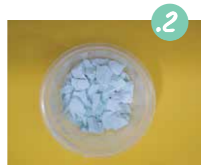
2. מכניסים את החתיכות לקפסת פלסטיק. שימו לב שהחתיכות יגיעו רק עד לכמחצית מגובה הקפסה.