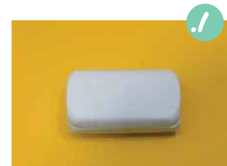
1. חותכים את הסבון המוצק לקביות קטנות.

פרשו מפת גילון על השלחן לפני התחלת העבודה, כדי למנוע לכלוך.