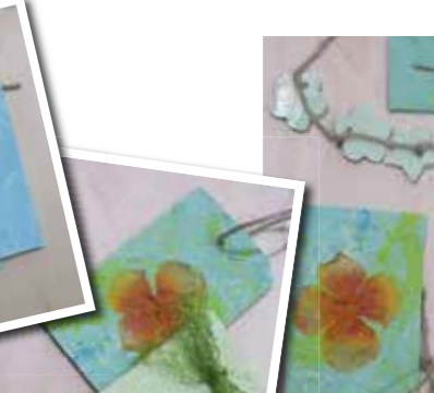
14. אל תשכחו להשאיר בסוף החוט לולאה לתליה על הקולב, על דלת החדר או בארון.