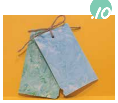
8. אם תרצו בהמשך להשחיל חוט - צרו עכשו חר בעזרת קיסם, עט או גפרור. מהרו, לפני שהסבון יתיבש...