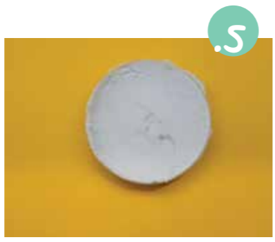
7. צקו את הסבון לתבניות שהכנתם (תבניות של פלנים יכולות להיות מצוינות), ונכו להתבשות.