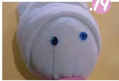
14. עשו תפור קטן, והוציאו את המחט שוב בחזרה דרך חור הפיט. חזרו על הפעולה בשנית.