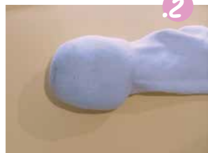
2. מלאו את תחתית הגרב עד שיווצר כדור בינוני.