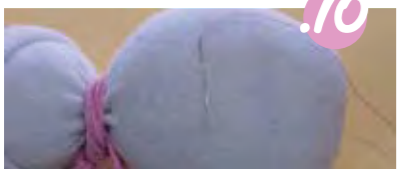
10. חלצה: כיון שליצירה אין צד אחורי לשים בו את הקשר, כמו כשתופרים כפתור בחלצה, נצטרך להסתיר אותו תחת הכפתור. השחילו חוט במחט, קשרו קשר בסוף, תקעו את המחט במקום בו אתם רוצים להעמיד את הכפתור, עשו תפור קטן - וצאו חזרה.