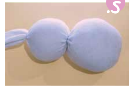
5. ושוב סגרו בגומייה.