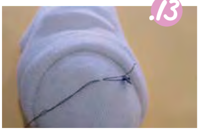
13. תחבו את המחט בפני הבבה במקום המתאים.