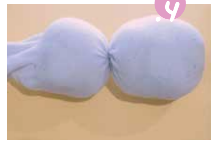
4. הכניסו שוב חמור מלוי מעל הגומייה, הפעם בכמות קטנה יותר.