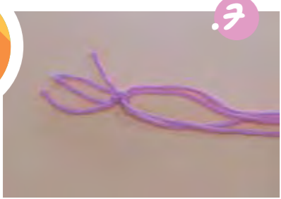
7. צעיף: טלו ארבעה חוטי צמר וקשרו אותם יחד.