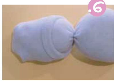
6. הפכו את חלקה העליון של הגרב על חלק הראש של הבבה, וסדרו לכובע יפה.