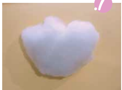
1. תלשיו חתיכה מחמור המלוי, וסדרו אותה לצורת כדור.