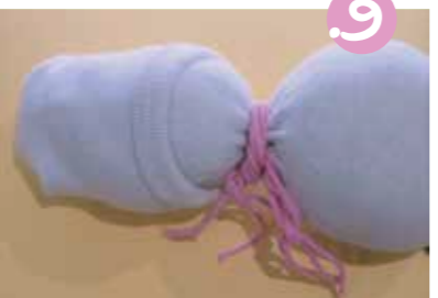
9. פרכו את הצעיף סביב 'צואר' הבבה.

7. הבבה מוכנה - עכשו נשאר לקשט אותה כיד הדמיון הטובה עליכם. הנה רעיונות שבהם אני השתמשתי. כל דרך אחרת מצינת לא פחות!