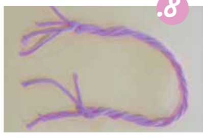
8. סובבו אותם זה על זה, וצרו קשר לסיים.