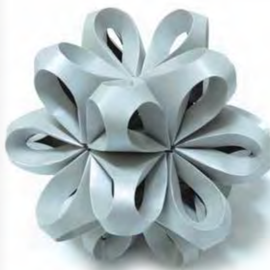
הנה הפדור המוכן!