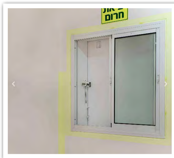
חלון עם סגירה של פלדה.