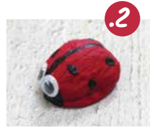
צבעו ראש שחור, קו באמצע ונקודות, והדביקו עינים זזות.

הידעת? שמה האמיתי של החפושית החמוזה הוא 'מושית השבע'. ה'שבע' המזכר בשמה הוא על שם שבע הנקודות שעל גבה.