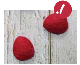
צבעו את הקלפה בצבע אדם.