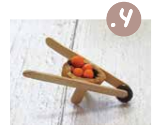
לאחר שהדבק התביש לגמרי: צרו מפלסטלינה משמשים קטנים ומלאו את המריצה.