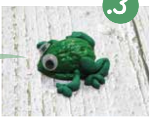
הצינו כף עוד רגל אחורית, ושתי רגלים קדמיות - קצרות יותר ומקפלות פחות.

ועכשיו, בלי לצבע את הקלפות נהפך אותו לחפצים קטנים וחמודים: