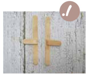
חתכו מקל ארטיק לשלושה חלקים שונים. השתמשו בשני הקצוות: הדביקו כל קצה באמצעו של מקל ארטיק שלם, כך שתוצר צורת קמץ.