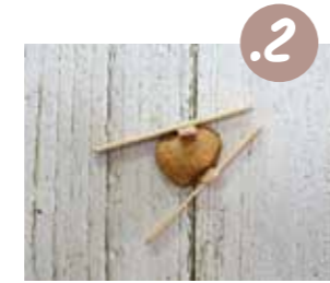
הדביקו את המקלות משני הצדדים של קלפה הפוכה, כשהם מתקרבים זה לזה אלכסונית, ובקצה נפגשים.