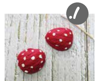
שוב צבעו את הקלפות באדם, אבל הפעם הוסיפו שפע של נקודות לבנות.