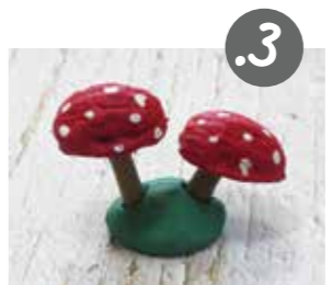
תקעו את הפטריות בגוש פלסטלינה.

למרות המראה החנני של הפטריות - אם אתם פוגשים בהן בטבע אי פעם, הזרה: הן רעילות!