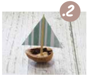
הכניסו פלסטלינה לקלפת אגוז, ותקעו את התרן בפלסטלינה.