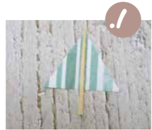
גזרו משלש שוה צלעות מנייר צבעוני, והדביקו באמצעו קיסם עץ.