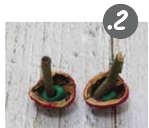
פשהצבע גבש - הפכו את הפטריות והצמידו לחלק הפנימי פלסטלינה (לא משנה הצבע). לתוך הפלסטלינה נעצו ענף קצר ושמן.