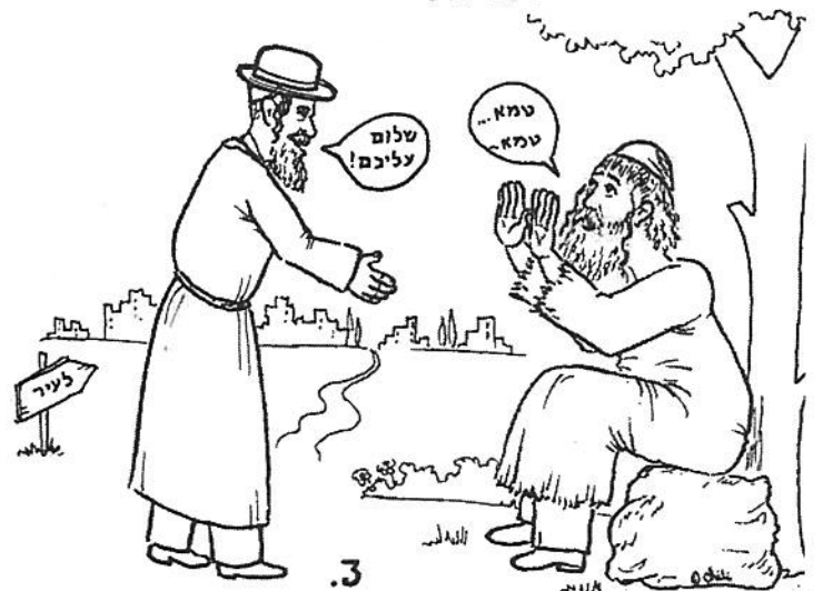
3. בדרך י"ט מחוץ למחנה בגדיז יהיו פרומים וראשו יהיה פרוץ ועל שפת יעה וטמא טמא יקרא