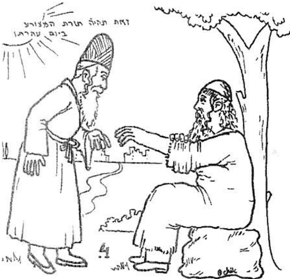
4. זאת תהיה תורת המצורע ביום עזרתו