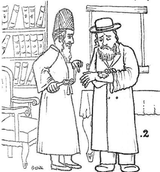
2. נגזר צרעת כי תהיה באדם והוכיח אל הבין