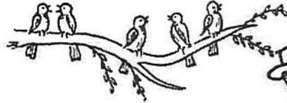
1. לפיכך הורקן לטהרתו צפרים שמצטפנין חסיד בצפצוק קול