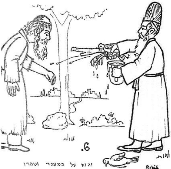
6. והנה על המטהר וטהרו