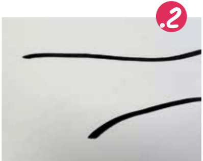
2. לאחר שהרקע יבש - מצירים עליו ענף בצבע שחר. איך מצירים ענף בצורה נכונה? מצירים ענף עבה.