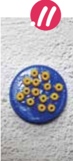
11. מדביקים חרוזים קטנים על פקק הבקבוק, וממתינים ליבוש מלא.