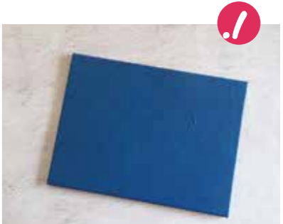
1. צובעים את הרקע בצבע אחיד.