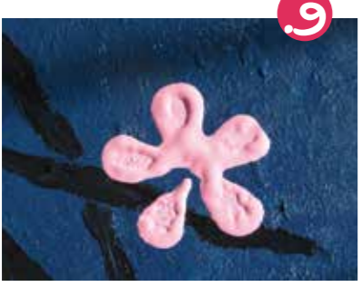
9. מרימים בזהירות את הבקבוק, שלא יזוז והצבע יפרח על הציור - והנה פרח מקסים!