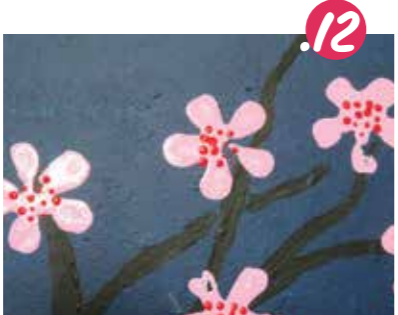
12. מטבילים את הפקק עם החרוזים בצבע ורד כהה וחותמים בו אבקנים במרכז כל פרח.