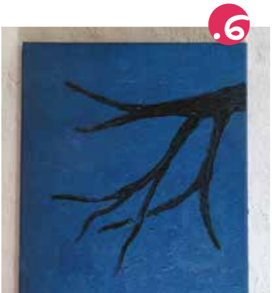
6. כעת הביטו בעצים בסביבתכם ועקבו אחרי הענפים, האם אתם רואים היכן הענפים העבים? הדקיקים? הדקיקים? באופן זה צירו ענף יפה על הרקע היבש.