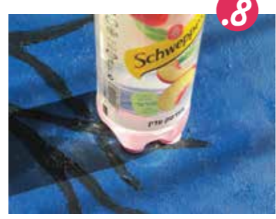
8. מניחים את הבקבוק בעדינות על אחד הענפים.