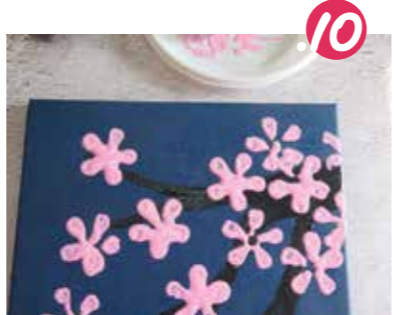
10. מוסיפים שפע פרחים על העץ, ככל שהענף עבה יותר - מטביעים עליו פרחים רבים יותר.