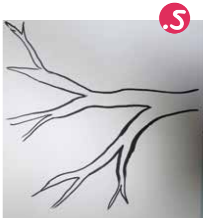
5. גם בציור עץ, הדרך זהה - הגזע הוא העבה ביותר, וממנו מתפצלים ענפים שהופכים לדקיקים יותר ויותר ככל שהם עוברים התפצלות רבות יותר.