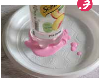
7. שופכים צבע ורד לצלחת, ומטבילים את תחתית הבקבוק בתוף הצבע.