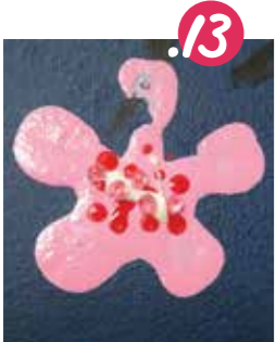
13. מדביקים מעט חרוזים במרכז כל פרח, והנה - השקדיה פורחת לתפארה!