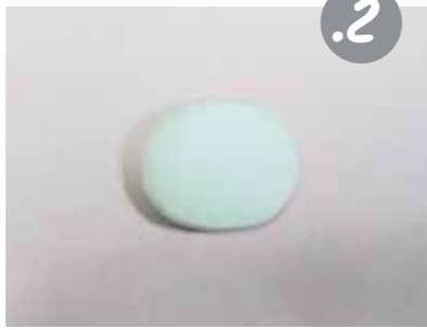
כדורו גוש אחד לאליפסה ומעכו אותה כך שתהיה שטוחה, בענכי כ-1 ס"מ.