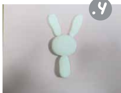
הכינו שני גלילים צרים וארכים, מעכו מעט והדביקו בחלק העליון של הראש - לאזנים.