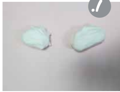
חלקו גוש קלי לבן לשני חלקים שווים. מחלק אחד ניצר את הראש ומהשני את שאר הגוף.