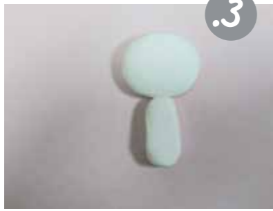
מהחלק הלבן השני הכינו את שאר חלקי הארנב: תלשו חתיכה, גלגלו גליל עבה וקצר והדביקו מתחת לראש.