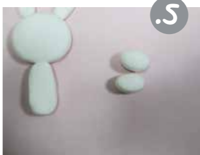
גלגלו שני כדורים אליפטיים מעט. אלו הרגלים.