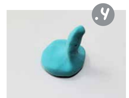
גלגלו את החדק לצורת גליל אחידה, ומעכו אותו מעט, שלא יהיה לגמרי גלילי.