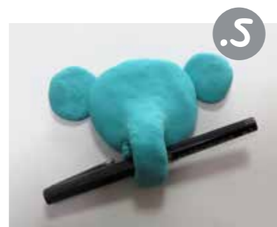
הניחו עט מתחת לחדק וסובבו סביבו את החדק עד שקצת החדק מתחבר חזרה לראש.