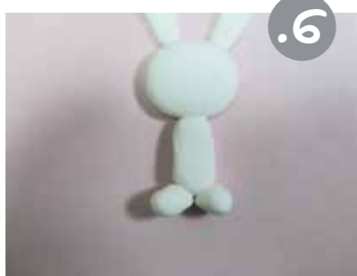
הדביקו אותם לתחתית הגוף כשהם פונים קדימה. הרגלים אמורות להחזיק את העט מלמטה.