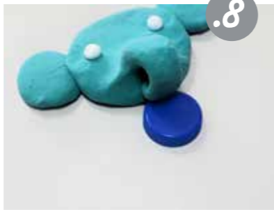
הדביקו אותם כאזנים משני צדי הראש. הוסיפו עגולי עינים קטנים בצבע נוסף.

הוציאו את עט בעדינות מהדק, והניחו תחת הדק חפץ קטן, כמו פקק, שיחזיק אותו עד ליבוש בצורה שבה עצבתם אותו, ולא יאפשר לו להשטט מטה.