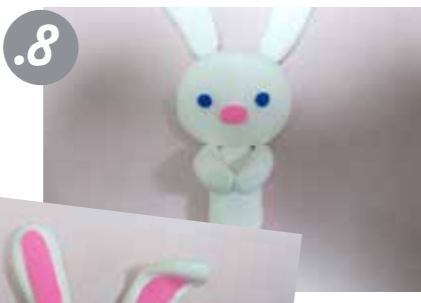
הוציאו את העט בזריזות. הוסיפו לפני הארנב: אף - אליפסה קטנה ונרדדה, ושני עגולי עינים. גלגלו שני גלילים ורדים, קצרים מעט מארז האזנים. שטחו אותם והדביקו לקדמת האזנים. אטו אחת קפלו מעט. עתה המתינו זמן שלמה.

מה שלום הפיל והארנבון? התיבשו? לגמרי-לגמרי? אם כן, הדביקו בדבק חם או בדבק ביג עגולי מגנט מאחוריהם, השחילו עטים ותלו על המקרר.