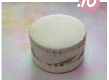
10. הכינו פסווי זהה גם לצד השני של התוף.