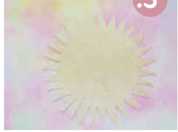
5. מחקו את העגול הפנימי.