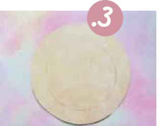
3. גזרו את עגול החיצוני.