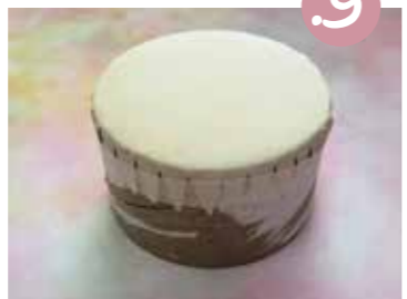
9. הדביקו אותם לדפון התוף בדבק מסקינג-טייפ.