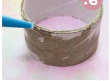
6. מרחו מסגרת דבק בקצה העליון של הגליל.