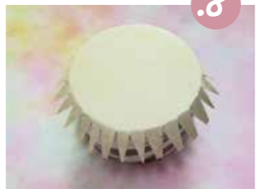
8. קפלו את המשלשים המבצבצים.