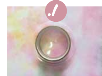
1. חפשו בבית חפץ עגול שיהקף שלו גדול קצת יותר מהסלופיפ, למשל מכסה של גבינה גדולה.