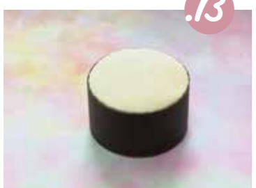
13. הדביקו את הבריסטול סביב התוף.