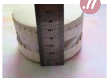
11. מדדו את גבה התוף.