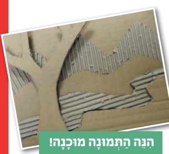
הנה התמונה מוכנה!