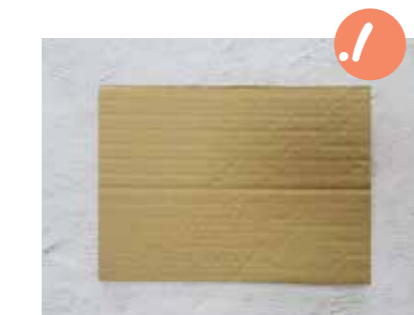
1. גזרו בסיס לתמונה - מלבן קרטון בגודל A4 (אפשר להניח את הדף על הקרטון ולשרטט סביבו את הגדל המתאים).