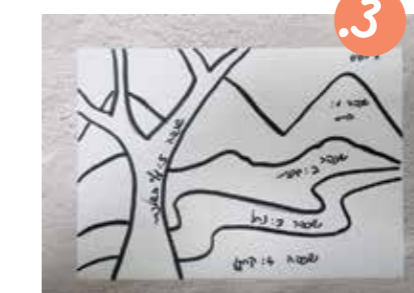
3. לדגמה, הציור שלנו כולל חמש שכתות (חוצי מהבסיס). השכתות התחתיות יהיו הנוף הרחוק יותר מהמתבונן, והשכתות הגבוהות - קרובות יותר.