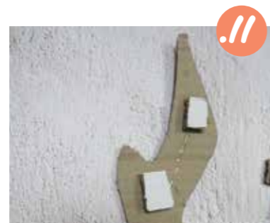
11. מאחורי השכתה הבאה הדביקו רבועי קרטון שייגביהו את השכתה.