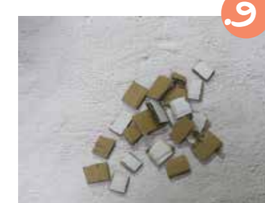
9. וגזרו המון רבועים קטנים של קרטון.