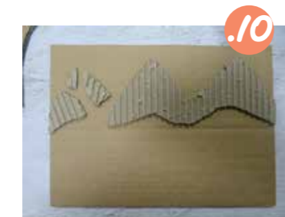
10. התחילו בהדבקת השכתות: סמנו את המקום המדויק של השכתה התחתונה והדביקו אותה לבסיס.