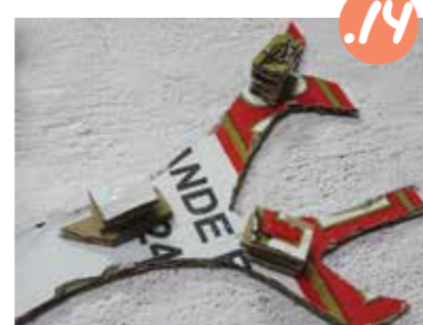
14. בשכתה הבאה - הדביקו שלוש שכתות של רבועי הגבהה, ובחמישית - ארבע.