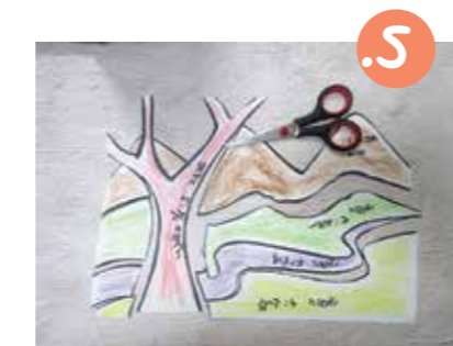
5. גזרו את כל החלקים.