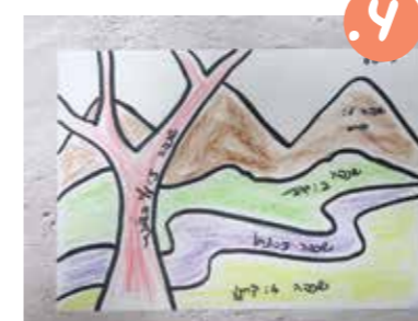
4. צבעו כל שכתה בצבע אחר, כדי שבהמשך יהיה לכם ברור איזה חלק שייך לאיזו שכתה.