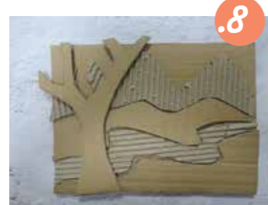
8. אחרי שגזרתם את כל החלקים - הניחו אותם על הבסיס בצורה מאורגנת.