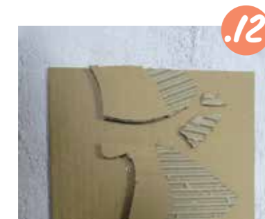
12. והדביקו את השכתה למקומה.