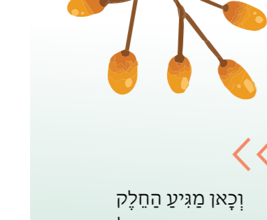
9. וקאו מגיע החלק האמנותי המנצל את מאפייניו המיוחדים של הקרטון: