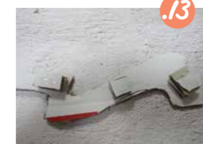
13. בשכתה השלישית: הדביקו תחת החלקים צמודים של שני רבועי קרטון זה על גבי זה, כדי ליצור הגבהה כפולה.