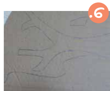
6. מקרטונים גזרים את חלקי התמונה: מניחים כל חלק על קרטון, משרטטים את קווי המתאר וגזרים. סמנו על כל חלק-קרטון לאיזו שכתה הוא שייך.