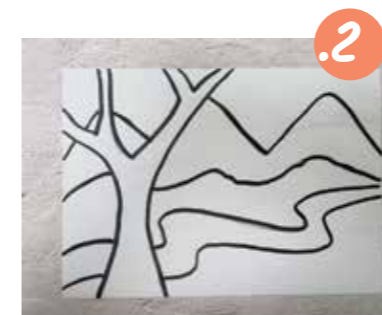
2. ציירו על הדף איור שיש בו מספר שכתות: רקע, אמצע וחזית. הציור צריך להיות בקוים פשוטים מאד, ללא פרטים קטנים ומרובים.