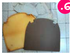
6. תוך כדי שאתם מסירים את שכבות הריפוד, שימו לב ממה הוא מורכב וכיצד - זה יקל עליכם לרפד מחדש.