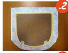
2. מניחים את הספוג ואת הבסיס על בד הריפוד כשהוא הפוך, וגוזרים אותו לפי צורת הבסיס בתוספת מסגרת של 5 ס"מ.