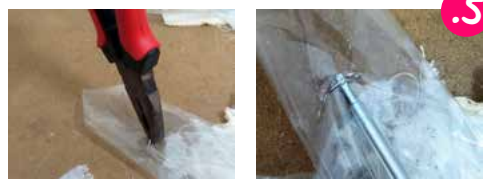
5. מהצד האחורי הוא תקוע בסיכות לבסיס. משחילים מברג ומשחררים מעט את הסיכה.

טיפ מהבן שלי לקוראים היקרים: כדאי למשוך חזק את בד הריפוד מהבסיס (לא נורא אם הוא נקרע, ממילא הוא בדרך לפח...). כך הסיכות נמשכות קצת, ואפשר לדלג על שלב המברג ולעבור ישירות לשלב הפלייר. בדוק ומנוסה.