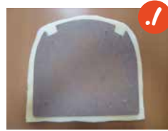
1. גוזרים ספוג ריפוד בגודל הגדול ב-2 ס"מ יותר מבסיס המושב - באורך וברוחב.