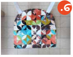
6. מניחים את המושב ומבריגים לתוכו חזרה את הברגים.

למקצוענים אלופים: כדאי לכסות את החלק החשוף של הבסיס ואת הקצה של בד הריפוד באלבד, לגימור מקצועי ומושלם.