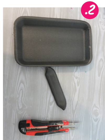
2. בסקין יפנית חותכים את שולי אחת מהתבניות - בעזרת מברג.