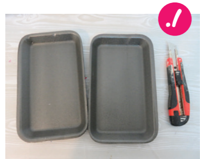
1. לוקחים שתי תבניות קלקר.

יענקי ושמוליק לוקחים תמיד לנסיעות שחמט מגנטי קטן. החלקים נצמדים למקומם במגנט, וגם כשהמכונית מטלטלת ומקפצת - כל החילים שעל הלוח נשארים במקומם. היום נכין משחק 'בול פגיעה' תוצרת בית, שמתאים גם הוא למשחק בנסיעות (וגם בבית...) - את החלקים תוקעים בחורים, ומנסים לנחש את סדרת הצבעים שבחר חברנו למשחק. הכנה פשוטה ונחמדה למשחק מקסים שיעסיק אתכם בנסיעות ארוכות או בשעות משעממות של חפשה... בהצלחה!