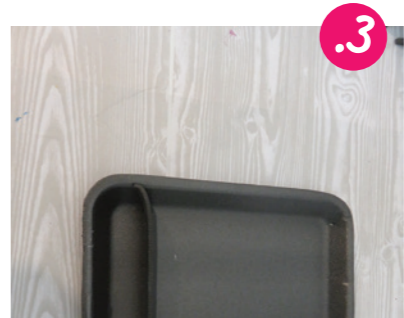
3. בעזרת דבק חם מדביקים את ה'שול' בסמוך לקצה התבנית השנייה, כשפניו אל הקצה - כך נוצר כעין מסך המסתיר את החלק הזה של התבנית. כאן נסתיר במהלך המשחק את הסדרה הסודית שבחרנו.