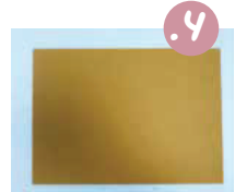
4. הניחו על קלקר את דף העטיפה.