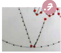
7. על קווים ארזים בלי תכנון מיוחד של תפסים - חוררי חורים במרווחים שווים בין האחד לשני.