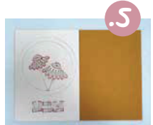
5. על החצי השמאלי שלו, הניחו את השרטוט שהכנתם.