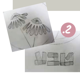
2. שרטטו היכן אמורים להיות תפסים (=תפריים).