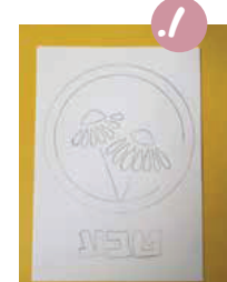
1. גזרו את הדף הלבן לחצי ושרטטו את הדגמה הרצויה לרקמה. אם אתם רוצים לרקם על כל המחברות - ציור דגמה לא מרפכת מדי, כדי שלא תתעאשו אחרי המחברת הראשונה. רקמה של שם המקצוע, איור קטן או שרטוט גאומטרי קליל - יכולים להיות מתוקים מאד על המחברת.