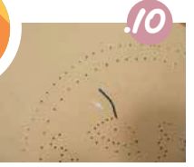
10. ועכשו רוקמים: השחילו חוט על מחט תפירה, והכניסו לחר הראשון. את קצה החוט הדביקו בחתיכה קטנה של דבק סלופיפ בצד האחורי של הדף.

הנראה חשובה ברקמה על נייר: אין למשוך את החוט בחזקה, אלא ממש בעדינות, אחרת הדף יתקמט, או גרוע מפר - יקרע.