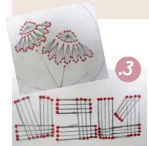
3. סמנו נקודות בקצוות של התפסים המתכננים.