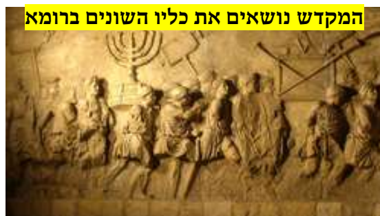
המקדש נושאים את כליו השונים ברומא

בתמונה: תבליט שער טיטוס. השבויים מארץ ישראל לאחר דיכוי המרד הגדול וחורבן