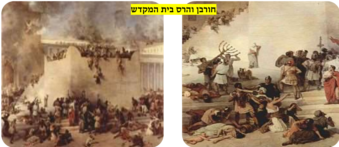
חורבן והרס בית המקדש

לפי המסורת, לאחר ביאת המשיח ובניית בית המקדש השלישי תשעה באב, כשאר הצומות על החורבן, יהפוך ליום של חג ושמחה. מסורת נוספת מספרת כי מלך המשיח עתיד להיוולד בתשעה באב.