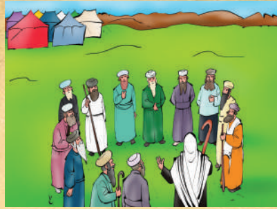
למה דוקא משה?

כיון שבנגב האדמה יבשה והמקום לא ירוק ופורח, ולכן רצה משה להראות קדם למרגלים את החלקים הפחות משבחים שבארץ ישראל, ואחר כך הם יעברו לאזורים המשבחים, וכך הם יעריכו אותם.