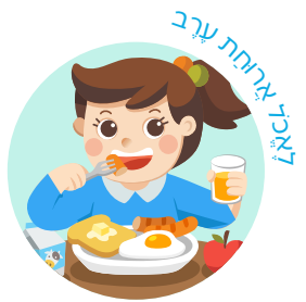
לאכול ארוחת ערב