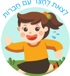
לצאת להצטר עם חברות