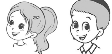
בת דודה בן דוד