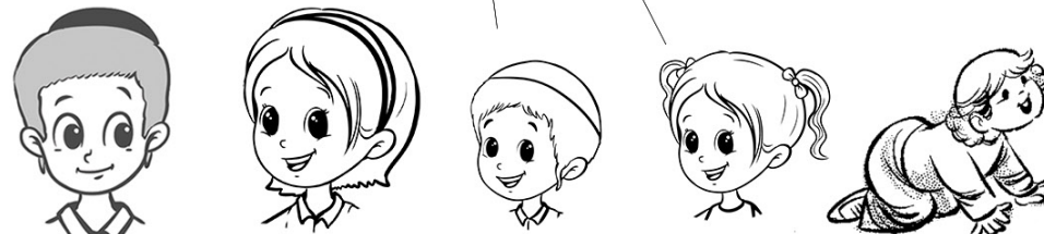
אחי הבכור אחותי הגדולה אחי אחותי אחי הקטן