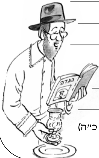
(עפ"י רש"י שמות ט"ו כ"ה)

נְשַׁאלָת הַשְּׂאֵלָה, אִיךְ הִקְדִּים אֶת הַשֵּׁבֶת לְפָנֵי הַר סִינַי הִרִי אֶת מְצוּוֹת הַשֵּׁבֶת קִבְּלוּ בְנֵי יִשְׂרָאֵל בְּהַר סִינַי - אַחֲרֵי שֶׁקִּבְּלוּ אֶת הַתּוֹרָה...?