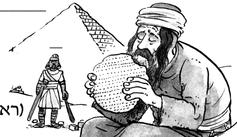
(ראשונים – אוצר מפרשי ההגדה)

איך יכול להיות שהיינו משעבדים כל כך הרבה זמן לפרעה, וכי פרעה היה חי כל כך הרבה שנים?